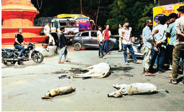
हरिभूमि न्यूज़ ॥ राजगढ़

क्षेत्र में यहां-वहां विचरण करते लावारिस गौवंश की सुरक्षा हेतु प्रशासन द्वारा किए जा रहे तमाम प्रयास नाकामो साबित हो रहे हैं। दूर-दराज आंतरिक मार्गों की बात तो दूर मुख्यालय पर ही अनेकों गायों सहित अन्य मवेशी मेन सड़क हादसों का शिकार हो रहे हैं। रविवार-सोमवार की रात्रि हुए इसी तरह की घटनाक्रम में एक रिस्पट कार चालक ने पहले करेड्री में कुछ गायों को कुचला एवं उसके बाद करेड्री राजगढ़ के बीच भी गायों में टक्कर मारी। इस दुर्घटना में 2 गायों के मरने की सूचना है वहीं कुछ गायें व अन्य मवेशी घायल हुए। घटना की सूचना मिलते ही राजगढ़ नगर के सेवाभावी युवक रात्रि को ही मौके पर पहुंचे और संबोधित कार की पहचान की। उल्लेखनीय है कि बीते एक महीने में अनेकों गायें सड़क हादसों में अपनी जान गवां चुकी हैं।