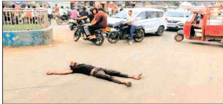
हरिभूमि न्यूज़ ॥ गुणा

शहर के तेलघानी चौराहे पर दोपहर को एक युवक बीच सड़क पर आकर लेट गया। जिससे यातायात प्रभावित हुआ। बताया गया कि उक्त युवक शराब के नशे में चूर था और सड़क पर उत्पात मचाते हुए वह तेलघानी चौराहे पर रोटीरी के पास बीच सड़क पर जाकर लेट गया। इस दौरान यातायात प्रभावित हुआ और वाहनों को साइड से निकलना पड़ा। हालांकि मामले की भनक जब