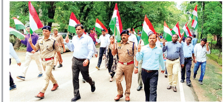
हरिगुणि न्यूज ललितपुर

पुष्प वर्षा और भारत माता के जयघोष के साथ शहर के प्रमुख स्थलों से गुजरी भव्य तिरंगा यात्रा